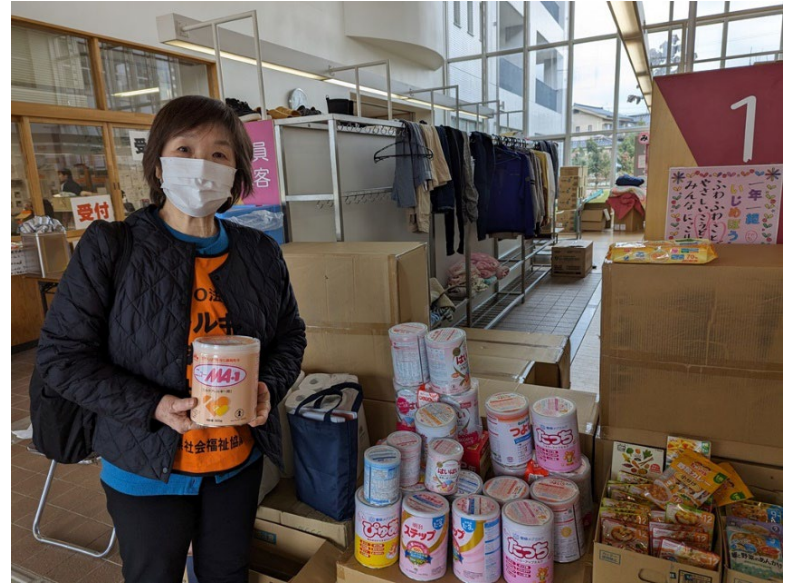
七尾市内の避難所の様子（1月15日）