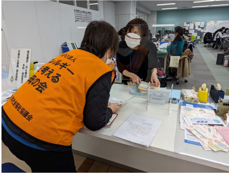
七尾市健康推進課（1月15日）